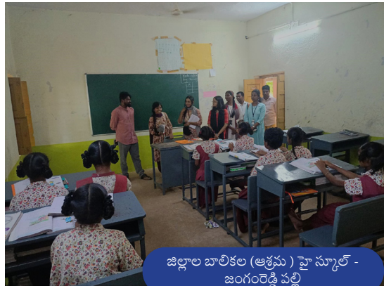
జిల్లాల బాలికల (ఆశ్రమ) హై స్కూల్ - జంగంరెడ్డి పల్లి

జీవిస్తున్నారు. చెంచు మరియు లంబాడా తెగలు తరతరాలు గా దట్టమైన అమ్రాబాద్ అటవీ ప్రాంతంలో నివసిస్తూ వస్తున్నారు. అమ్రాబాద్ కు సరిగా 4.5 కిలోమీటర్ల దూరంలో జంగం రెడ్డి పల్లి అనే గ్రామంలో నేను చెంచు సమూహానికి చెందిన మహిళలతో మాట్లాడాను. నేను