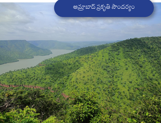
అమ్రాబాద్ ప్రకృతి సౌందర్యం

వారి పిల్లల విద్య గురించి అడిగినప్పుడు, ఒక మహిళా “నాకు ముగ్గురు కొడుకులు ఉన్నారు. నా పెద్ద కొడుకుకు 17 వంపత్యరాల వయసు కానీ స్కూల్ కి వెళ్ళడం లేదు. (కలేనా) మహమ్మారి కంటే ముందు బాగానే చదువుకునే వాడు, స్కూల్ మూత పడిన తర్వాత, సరైన మార్గం చెప్పేవారు లేక గెర్రెల పెంపకం మొదలు పెట్టాడు. నేను చదువుని కొనసాగించమని బ్రతిమిలాడినా కూడా, స్కూల్ కి వెళ్ళడానికి నిరాకరించాడు. నేను కూడా అంతకు మించి ఇబ్బంది పెట్టలేదు; అతను ఇప్పుడు పనే