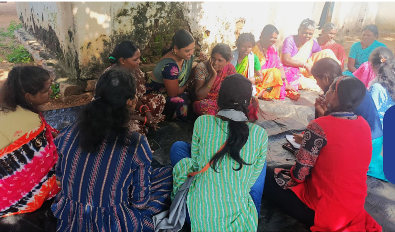
చెంచు మహిళలు వారి పిల్లల అనుభవిస్తున్న విద్యా సమస్యల గురించి చర్చిస్తున్నారు.

హై స్కూల్ లోని 6 నుండి 10 వ తరగతి చదువుతున్న విద్యార్థులతో మాట్లాడటంపై, ఎక్కువ మంది విద్యార్థులు ST లంబాడ తెగ నుండి ఉన్నారు,